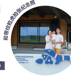
透过宽大的落地窗，享受环抱世界遗产的美丽山景。